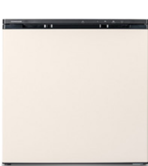
롯데하이마트가 만든 HIMAIDE

디에이치글로벌(회장 이정권)에 따르면 이번에 출시한 다목적 김치냉장고는 롯데하이마트 자체 브랜드 ‘하이메이드’의 PB 상품으로, 다수의 김치냉장고를 제조해 온 (주)디에이치글로벌의 기술력으로 생산했다.